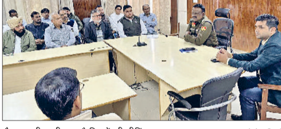
कैथल। डीएसपी द्वारा कैमिस्टों की मीटिंग।

भगवान स्वयं कल्याण के लिए अवतरित होते हैं। जब आचार्य ने यशोदा के वात्सल्य, नंद बाबा के आशीर्वाद और देवकी-वसुदेव के त्याग का वर्णन किया, तो कई श्रद्धालुओं की आंखें भक्ति के अश्रुओं से भर उठीं। इसके उपरांत आचार्य ने भक्तवत्सल भगवान वामन अवतार का मार्मिक विवरण प्रस्तुत किया।