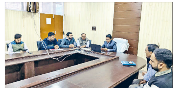
नरवाना। समाधान शिविर में शिकायतें सुनते एसडीएम।