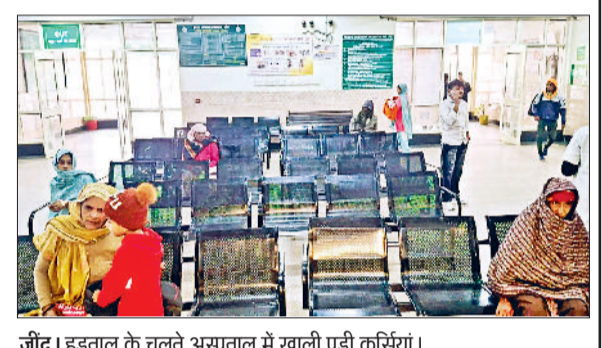
जींद। हड़ताल के चलते अस्पताल में खाली पड़ी कुर्सियां।

लगातार ओपीडी में आ रही गिरावट चिकित्सकों ने आठ दिसंबर से अपनी हड़ताल की शुरूआत की थी। तब से लेकर अब तक लगातार ओपीडी में गिरावट आ रही है। आठ दिसंबर को 1062, दस दिसंबर को 1167, तथा 12 दिसंबर गुरुवार को 1143 ओपीडी रही। वहीं अब लोग उपचार के लिए आर्युष विंग की तरफ रुख कर रहे हैं। हड़ताल के चलते यहां 30 प्रतिशत तक ओपीडी में उछाल आया है। पहले जहां 200 मरीज ओपीडी में आते थे वहीं अब 250 से अधिक मरीज ओपीडी में पहुंच रहे हैं।