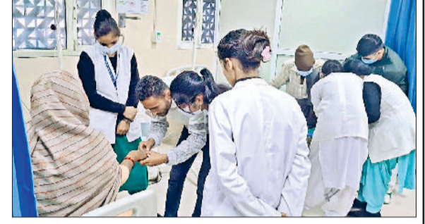
जींद। इमरजेंसी में उपचार करते हुए व सीखते हुए नर्सिंग छात्राएं।

राज्य कार्य समिति की बैठक में निर्णय लिया गया था कि एचसीएमएस संवर्ग के सभी डॉक्टर अनिश्चित काल के लिए सभी प्रकार की चिकित्सा सेवाएं पूरी तरह से बंद रखेंगे। जब तक कि हमारी मांगें पूरी नहीं हो जाती या सरकार के साथ बातचीत के माध्यम से कोई सहमत