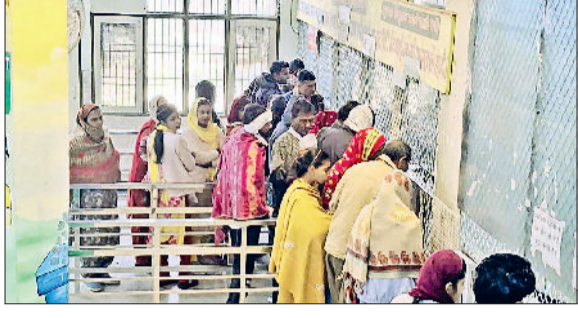
जींद। नागरिक अस्पताल में ओपीडी के लिए रिलीफ कटवाते हुए लोग।