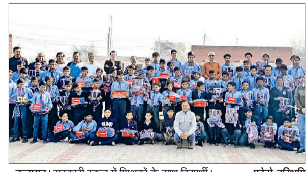
कलायत। सरकारी स्कूल में शिक्षकों के साथ विद्यार्थी।