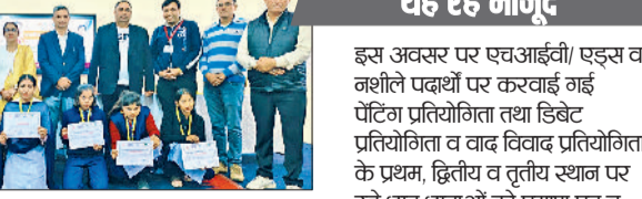
यह रहे मौजूद

नगर पार्श्व शमशेर फौजी कैथल रहे। फौजी ने छात्र-छात्राओं को जागरूक करते हुए बताया कि आज नौजवानों में एक विशेष प्रकार का नशा पांव पसार रहा है जो मोबाइल के माध्यम से सोशल मीडिया के इस्तेमाल का है। सोशल मीडिया के गलत इस्तेमाल से आज नौजवान