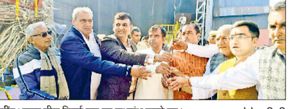
जीद। शुगर मील पिराई सत्र का शुभारंभ करते हुए।

जिसके तहत हरियाणा सरकार द्वारा गन्ने के दाम में 15 रुपये प्रति विंटल की वृद्धि करते हुए इसे 415 रुपये प्रति विंटल किया गया है, जो पूरे देश में सबसे अधिक है। इससे राज्य के किसानों को सीधा आर्थिक लाभ प्राप्त होगा। उन्होंने कहा कि जीद सहकारी चीनी मिल में लगभग 250 अधिकारी एवं कर्मचारी कार्यरत हैं तथा लगभग 1500 किसान इस मिल से जुड़े हुए हैं। मिल को कई बार राष्ट्रीय स्तर पर सम्मान प्राप्त हो चुका है। पिछले सीजन में 9.94 लाख विंटल गन्ने की पिराई कर 8.87 प्रतिशत रिकवरी के साथ 88,150 विंटल चीनी का उत्पादन किया गया था। इस वर्ष मिल द्वारा 15