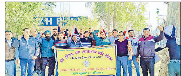
सीवन। बिजली बोर्ड में नारेबाजी करते कर्मचारी।

प्रशासनिक लापरवाही बताया। के अभाव को लेकर भी नगर निवासियों ने बुनियादी सुविधाओं पालिका को कटघरे में खड़ा किया।