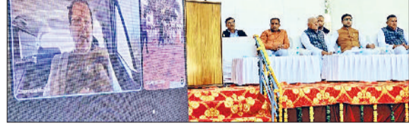
जीद। वीसी के माध्यम से संदेश देते मंत्री अरविंद शर्मा।

जिसके तहत हरियाणा सरकार द्वारा गन्ने के दाम में 15 रुपये प्रति विंटल की वृद्धि करते हुए इसे 415 रुपये प्रति विंटल किया गया है, जो पूरे देश में सबसे अधिक है। इससे राज्य के किसानों को सीधा आर्थिक लाभ प्राप्त होगा। उन्होंने कहा कि जीद सहकारी चीनी मिल में लगभग 250 अधिकारी एवं कर्मचारी कार्यरत हैं तथा लगभग 1500 किसान इस मिल से जुड़े हुए हैं। मिल को कई बार राष्ट्रीय स्तर पर सम्मान प्राप्त हो चुका है। पिछले सीजन में 9.94 लाख विंटल गन्ने की पिराई कर 8.87 प्रतिशत रिकवरी के साथ 88,150 विंटल चीनी का उत्पादन किया गया था। इस वर्ष मिल द्वारा 15