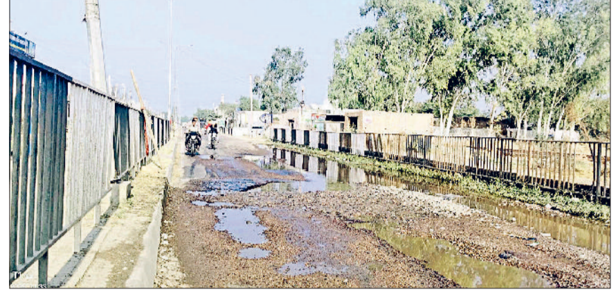
अलेवा। नगूरा गांव में जींद-असंध मार्ग पर नालों के चलते सड़क पर दिखाई देते बने गड्डे।

सड़क गड्डों में तबदील गांव के लोगों का कहना है कि सड़क पर हरदम नालों का पानी खड़ा होने के कारण सड़क पर बड़े-बड़े गड्डे बन गए हैं। रात के अंधेरे में हाइवे पर तेज रफ़ाट में चल रहे वाहनों को गड्डों के चलते अचानक से बेक लगाना पड़ता है। जिसके कारण आए दिन हादसे हो रहे हैं। यही वही दोपहिया वाहन चालक तो गड्डों में गिरकर चोटिल तक हो चुके हैं। नगूरा में हाइवे पर यह समस्या काफी पुरानी है लेकिन फिर भी विभाग कुम्भकर्ण नदी बंधी हुआ है। ग्रामीणों ने जिला प्रशासन के आलाधिकारियों से मामले को गंभीरता को देखते हुए जल्द से जल्द समाधान का समाधान करने की मांग की है ताकि कोई बड़ी घटना न हो।