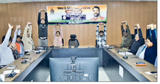
कैथल। लघु सचिवालय के स्टफ को योगासन कराते विशेषज्ञ