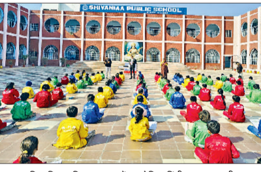
उद्यान। शिवािनिया पब्लिक स्कूल में आयोजित हिंदी व्याकरण परीक्षा।